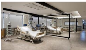
③スタジオでの実寸検証